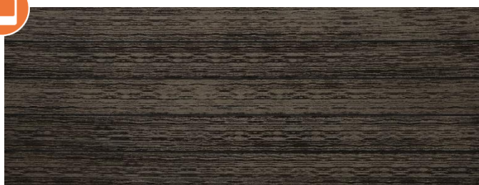
Thermoesche (Optik) gebürstet