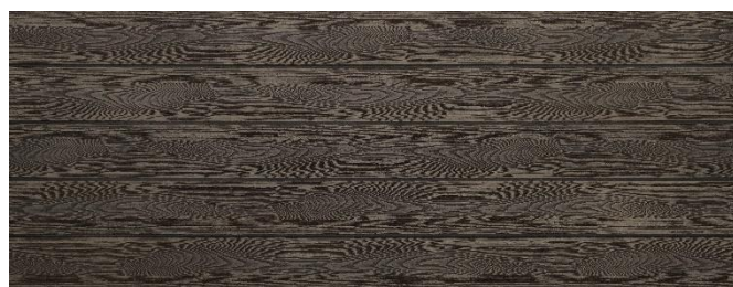
Thermoesche (Optik) struktur