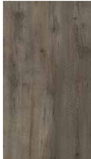
Primary Pine Grege 3977 018 22.9 x 121.9 cm