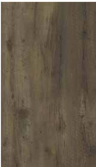
Primary Pine Dark Brown 3977 017 22.9 x 121.9 cm