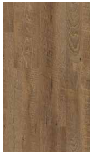
Smoked Oak Natural 3977 002 22.9 x 121.9 cm