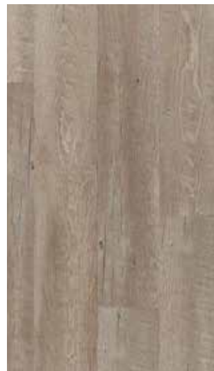
Smoked Oak Light Grey 3977 004 22.9 x 121.9 cm