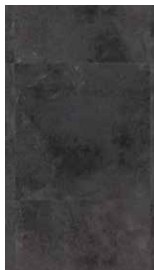
Sandstone Black 3979 004 61 x 30.5 cm