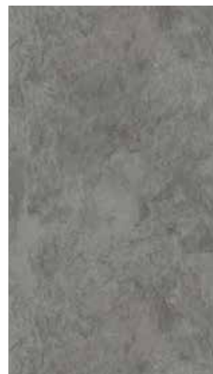
Original Slate Grey 3979 007 61 x 30.5 cm