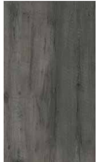
Primary Pine Dark Grey 3977 019 22.9 x 121.9 cm