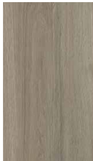
Soft Oak Light Beige 3977 015 22.9 x 121.9 cm