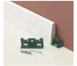
CLIP HOLDER Artikelnummer: 8019 101 Die Clips helfen, die Leiste zu fixieren und ermöglichen einen schnellen Austausch, ohne die Wand zu beschädigen.