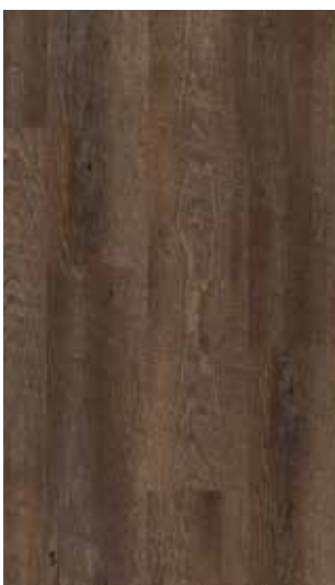
Smoked Oak Brown 3977 001 22.9 x 121.9 cm