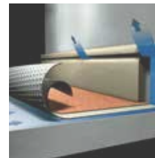
VS 100 - VENTILIERTE/HINTERLÜFTETE HOLZSOCKELLEISTE Artikelnummer: 1252 030 (unbehandelt) 13x56x3000 mm zu verkleben. Auf Anfrage erhältlich.