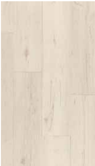
Soft Oak White 3977 011 22.9 x 121.9 cm