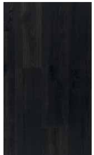
Soft Oak Black 3977 006 22.9 x 121.9 cm