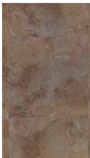
Sandstone Brown 3979 005 61 x 30.5 cm