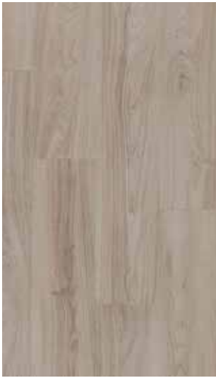
Aspen Oak Grey 3977 013 22.9 x 121.9 cm