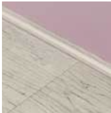
HOHLKEHLEISTE Artikelnummer: 8007 --- Vorwiegende Nutzung bei Renovierungen.