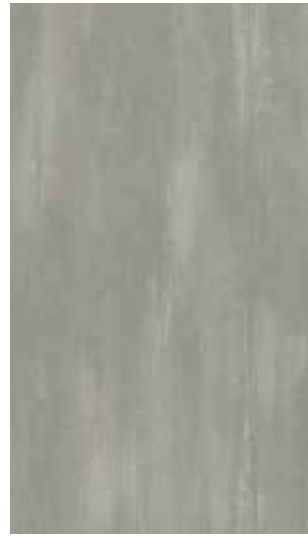
Colored Pine Grege 3977 023 22.9 x 121.9 cm