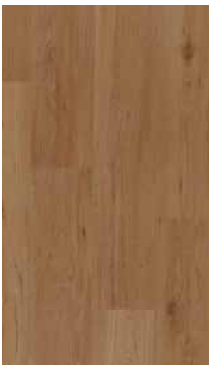
Soft Oak Natural 3977 008 22.9 x 121.9 cm 3976 008 15.2 x 91.4 cm