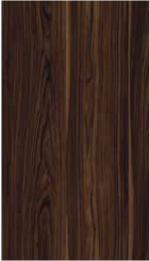
Walnut Brown 3976 033 15.2 x 91.4 cm