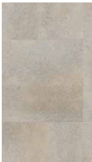
Venezia Beige 3979 002 61 x 30.5 cm