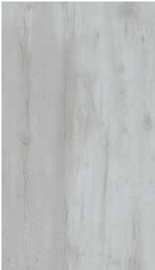
Primary Pine White 3977 021 22.9 x 121.9 cm