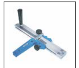
STRIP CUTTER Artikelnummer: 1464 001 Dieses Werkzeug erleichtert das Zurechtschneiden von Sockelleisten, Friesen und Treppenecken.