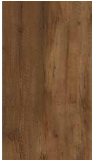
Primary Pine Natural 3977 020 22.9 x 121.9 cm