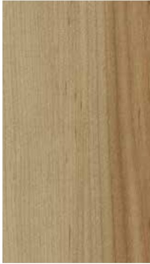
Beech Natural 3976 020 15.2 x 91.4 cm