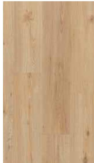
Soft Oak Light Brown 3977 012 22.9 x 121.9 cm 3976 012 15.2 x 91.4 cm