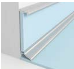
HALBFLEXIBLE PVC-SOCKELLEISTE FÜR GERADE WÄNDE Artikelnummer: 1462 --- ISS60 - 10x60x2570 mm Der Bodenbelag wird eingeklebt. In 6 Farben erhältlich.