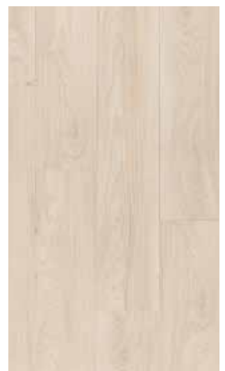
Aspen Oak Beige 3977 014 22.9 x 121.9 cm