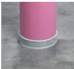
HALBFLEXIBLE SELBSTKLEBENDE PVC-SOCKELLEISTE FÜR GEBOGENE WÄNDE UND SÄULEN Artikelnummer: 1462 --- ISF60 - 10x60x2570 mm Der Bodenbelag wird eingeklebt. In 6 Farben erhältlich.