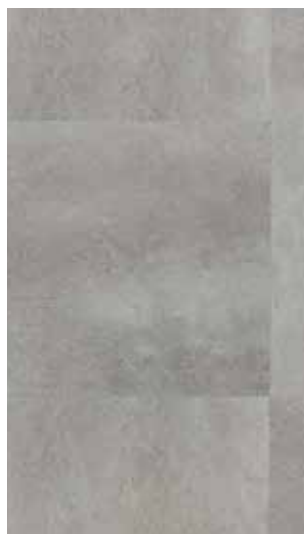
Venezia Grey 3979 001 61 x 30.5 cm