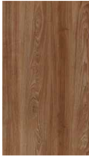
Aspen Oak Natural 3977 016 22.9 x 121.9 cm