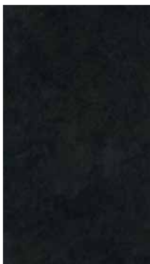
Original Slate Black 3979 006 61 x 30.5 cm