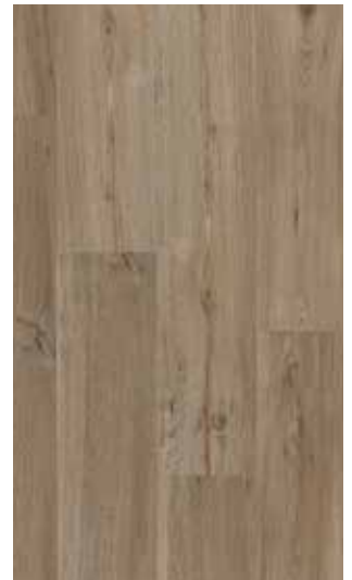
Soft Oak Light Grey 3977 010 22.9 x 121.9 cm 3976 010 15.2 x 91.4 cm