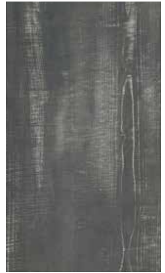
Colored Pine Grey 3977 022 22.9 x 121.9 cm