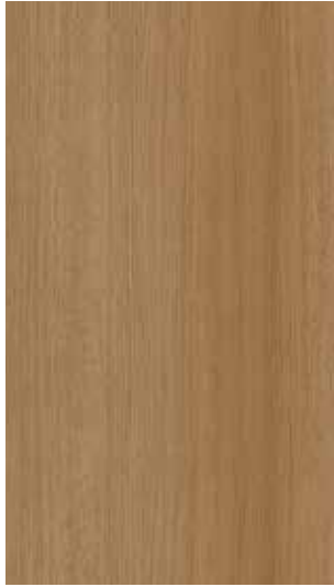
Ash Honey 3976 032 15.2 x 91.4 cm