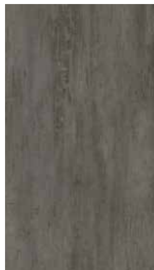
Scratched Metal Grey 3979 008 61 x 30.5 cm