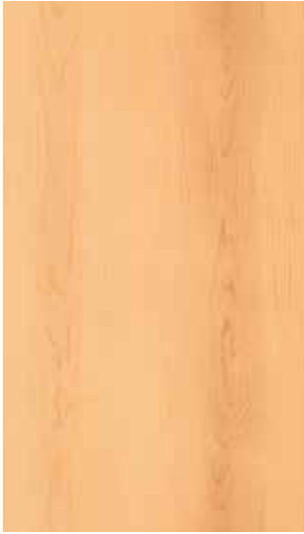
Maple Natural 3976 031 15.2 x 91.4 cm