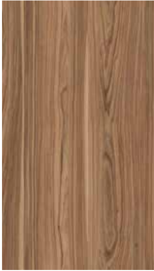
Walnut Light Brown 3976 034 15.2 x 91.4 cm