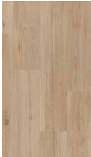
Soft Oak Beige 3977 009 22.9 x 121.9 cm 3976 009 15.2 x 91.4 cm