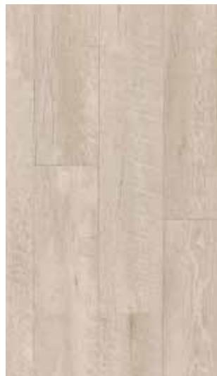
Smoked Oak White 3977 005 22.9 x 121.9 cm