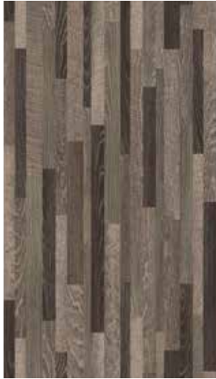
Vintage Strip Warm Brown 3976 030 15.2 x 91.4 cm