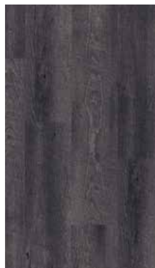
Smoked Oak Black 3977 000 22.9 x 121.9 cm