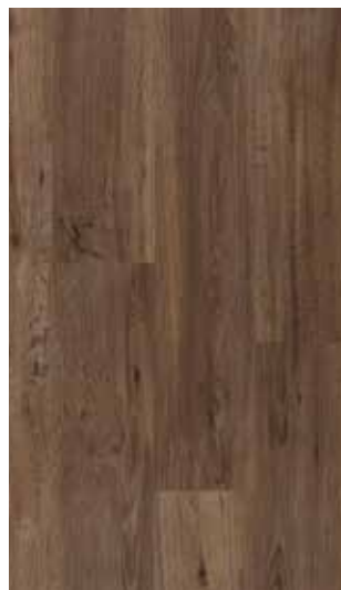
Soft Oak Brown 3977 007 22.9 x 121.9 cm 3976 007 15.2 x 91.4 cm