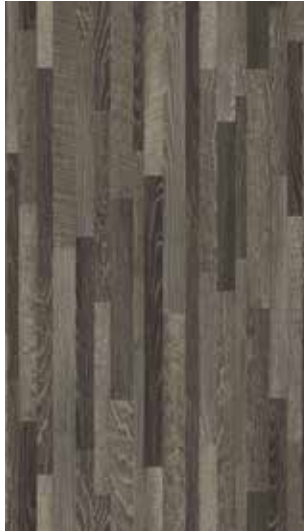
Vintage Strip Dark Brown 3976 029 15.2 x 91.4 cm