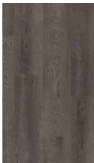
Smoked Oak Dark Grey 3977 003 22.9 x 121.9 cm