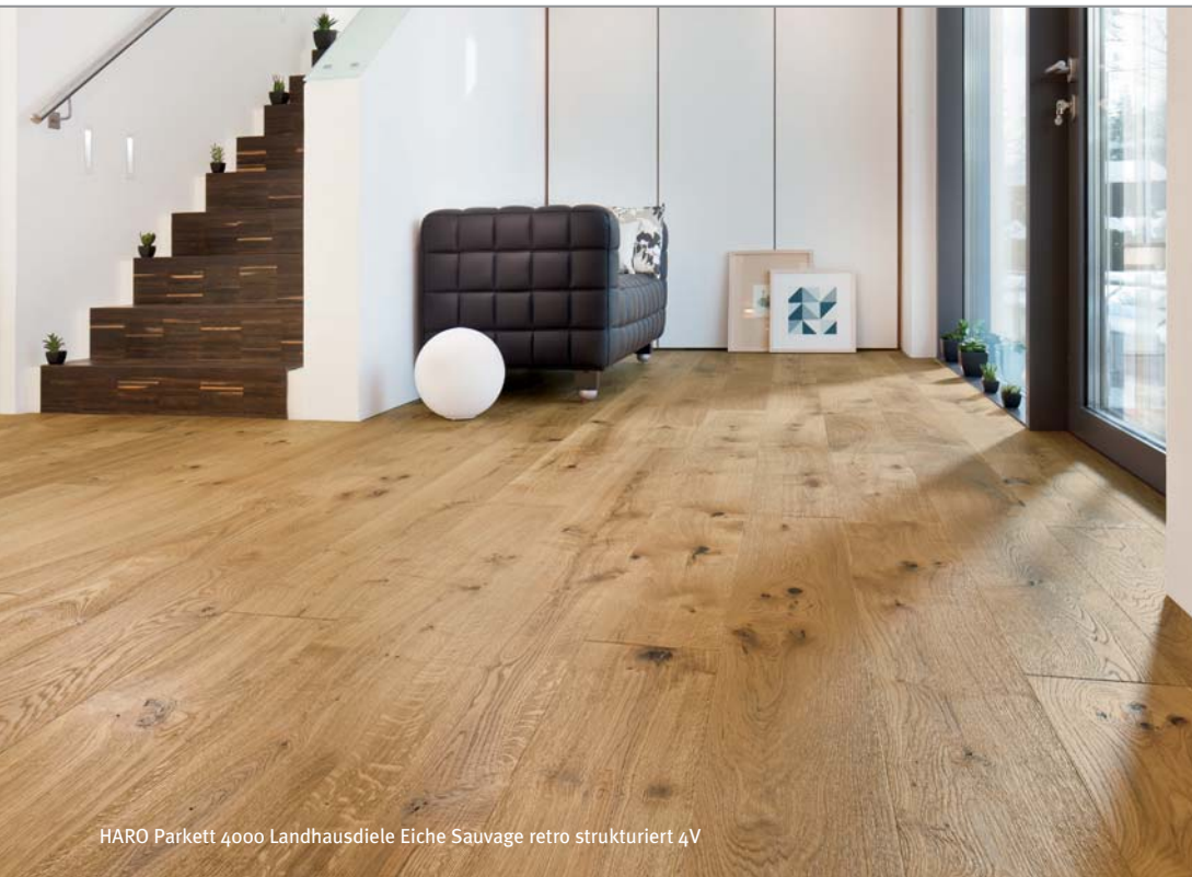
HARO Parkett 4000 Landhausdielen Eiche Sauvage retro strukturiert 4V

Hamberger Flooring GmbH & Co. KG Postfach 10 03 53 83003 Rosenheim Deutschland