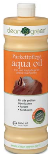
aqua oil® Intensivpflege

Zur Auffrischung / Renovierung von strapazierten, geölten, sehr dunklem Parkett empfehlen wir aqua oil® black. Für weiß geöltes Parkett empfehlen wir aqua oil® white.